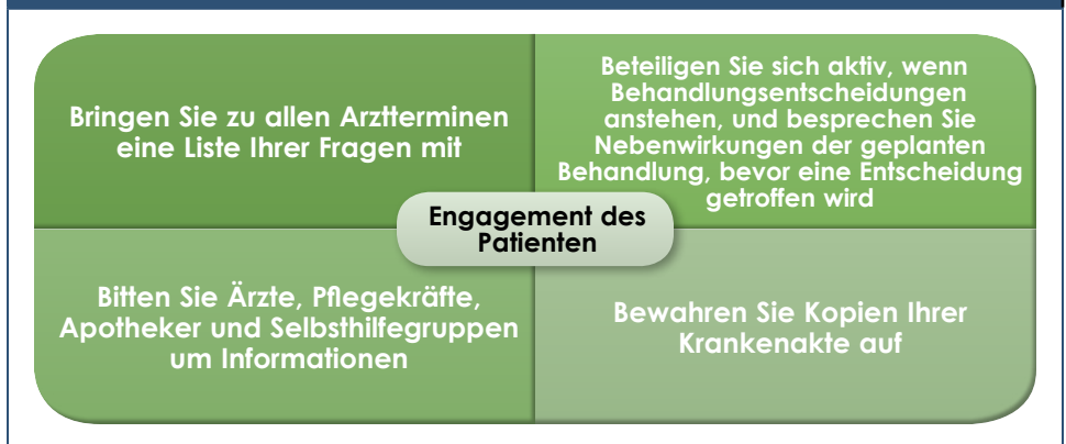
Abbildung 3. Empfehlungen für Patienten, um sich bei der gemeinsamen Entscheidungsfindung stärker zu engagieren

Von großer Bedeutung für das Wohlergehen des Patienten im Alltag ist es, die Nebenwirkungen der Krebsbehandlung in den Griff zu bekommen. Ärzte und Pflegekräfte sollten Patienten unbedingt auf alle Nebenwirkungen hinweisen, die mit dem Beginn einer neuen Therapie auftreten können. Dazu gehört auch eine Beratung, worauf bei den Nebenwirkungen genau zu achten ist. Außerdem